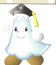
静岡大学キャラクターしずっぴー

主催/静岡大学グリーン科学技術研究所 共催/浜松市、浜松科学館 問い合わせ/浜松科学館 E-mail: hames@hamamatsu-kagakukan.jp