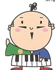
出世大名 家康くん

主催/静岡大学グリーン科学技術研究所 共催/浜松市、浜松科学館 問い合わせ/浜松科学館 E-mail: hames@hamamatsu-kagakukan.jp